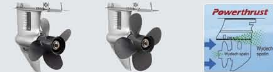
Śruba standardowa Śruba Power Thrust Napór wody przy biegu wstecznym

Wszystkie modele silników BF8/10/15/20 posiadają bardzo wytrzymałe przekładnie oraz specjalnie opracowany, boczny układ wyciechy spalin biegu wstecznego. Dodatkowo w celu uzyskania istotnego przyspieszenia, tak istotnego przy łodziach wypornościowych, silniki te mogą być wyposażone w specjalne śruby Power Thrust zapewniające przyspieszenie przyspieszenia rzędu 60% na biegu wstecznym oraz 15% do przodu.